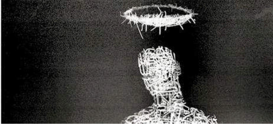
"Bable Confusion" digital fotomanipulering av Shwan Dler Qaradaki.

Inne fra galleriet høres en kakofoni av stemmer. Det er åpning på ØKS. En levende støy og vitalitet i stemningen sklir over til en vandring fra verk, til verk, – til verk.