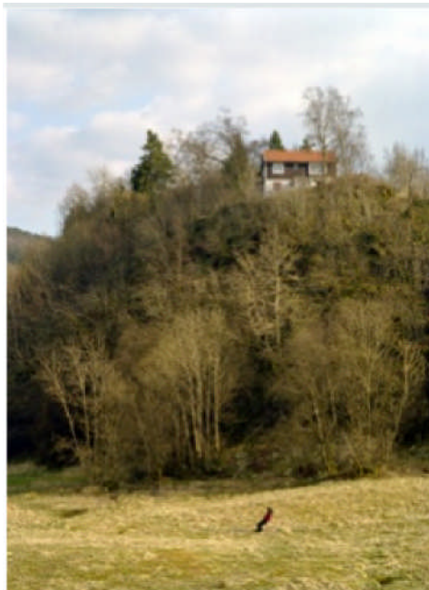
Landschaftsaufnahme von Tonje Li: „Sudden Drop“

Eröffnung der Ausstellung und Präsentation des Sommerfoyers in der Kunsthalle St. Annen