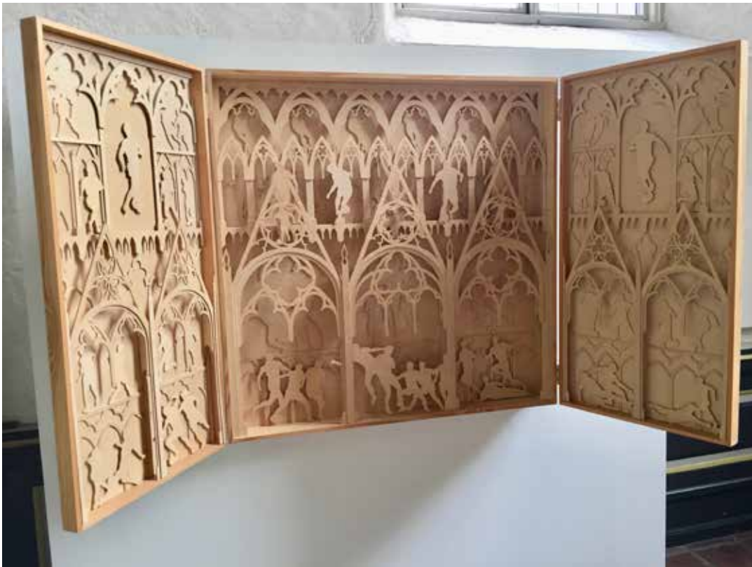
ALTER: Den tyske kunstneren Andreas Neuffer har skåret et alterskap i finér. De hellige figurene er erstattet med lekende fotballspillere.