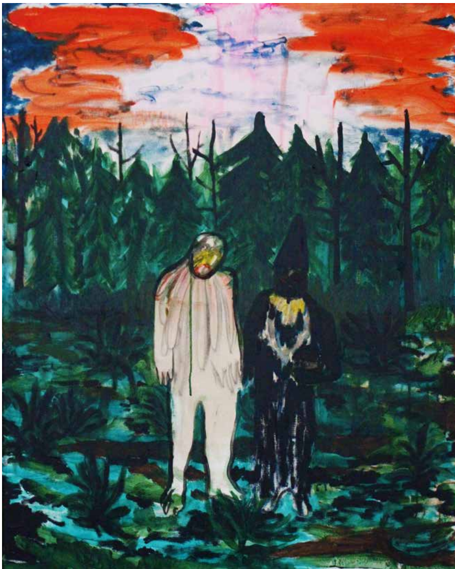
Linn-Mari Staalnacke, Paul and the Shaman (2016). Akryl på lerret, 100x80cm.

Linn-Mari Staalnacke har utstilling på Harpefoss Hotell, Sør-Fron, åpning 11.05.2019