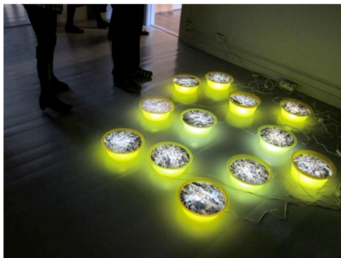
Eva Ammermann, Lysskåler Zea II, 2012

Utstillingen Stereo. Not Mono åpnet på Galleri F15 i 2012, og var en visning av et juryert utvalg av tyske og norske kunstverk. Utstillingen blir også vist i Stadtgalerie am ElbeForum i Brunsbüttel i januar 2013.