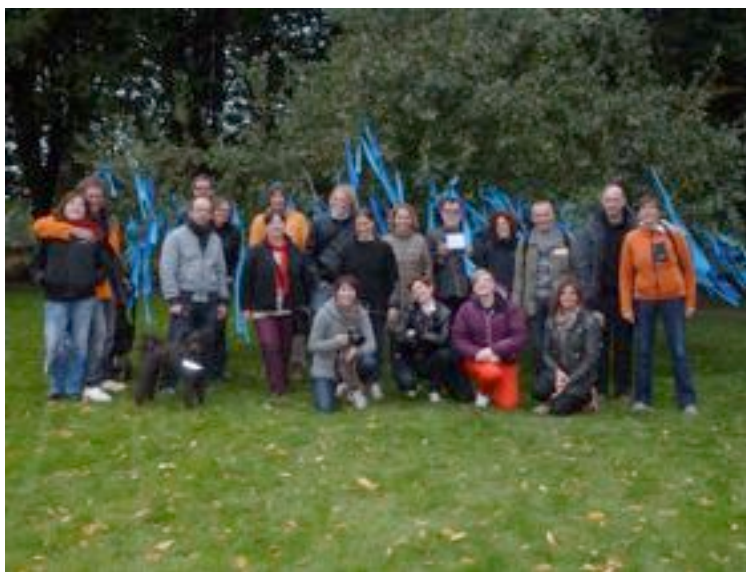
Deltagere på Stereo. Not Mono , 2012

Besøksprogrammet for kunstnerne som deltok på Stereo. Not Mono varte fra 14. til 17. september. De tyske kunstnere og andre deltagere ble innlosjert hos norske kollegaer. Det ble arrangert et symposium i Galleri F15 med lunsjer og middager samt et omfattende besøksprogram i Oslo og Østfold. Styret og andre frivillige stod for transport av deltagerne til og fra utstillingsstedet.