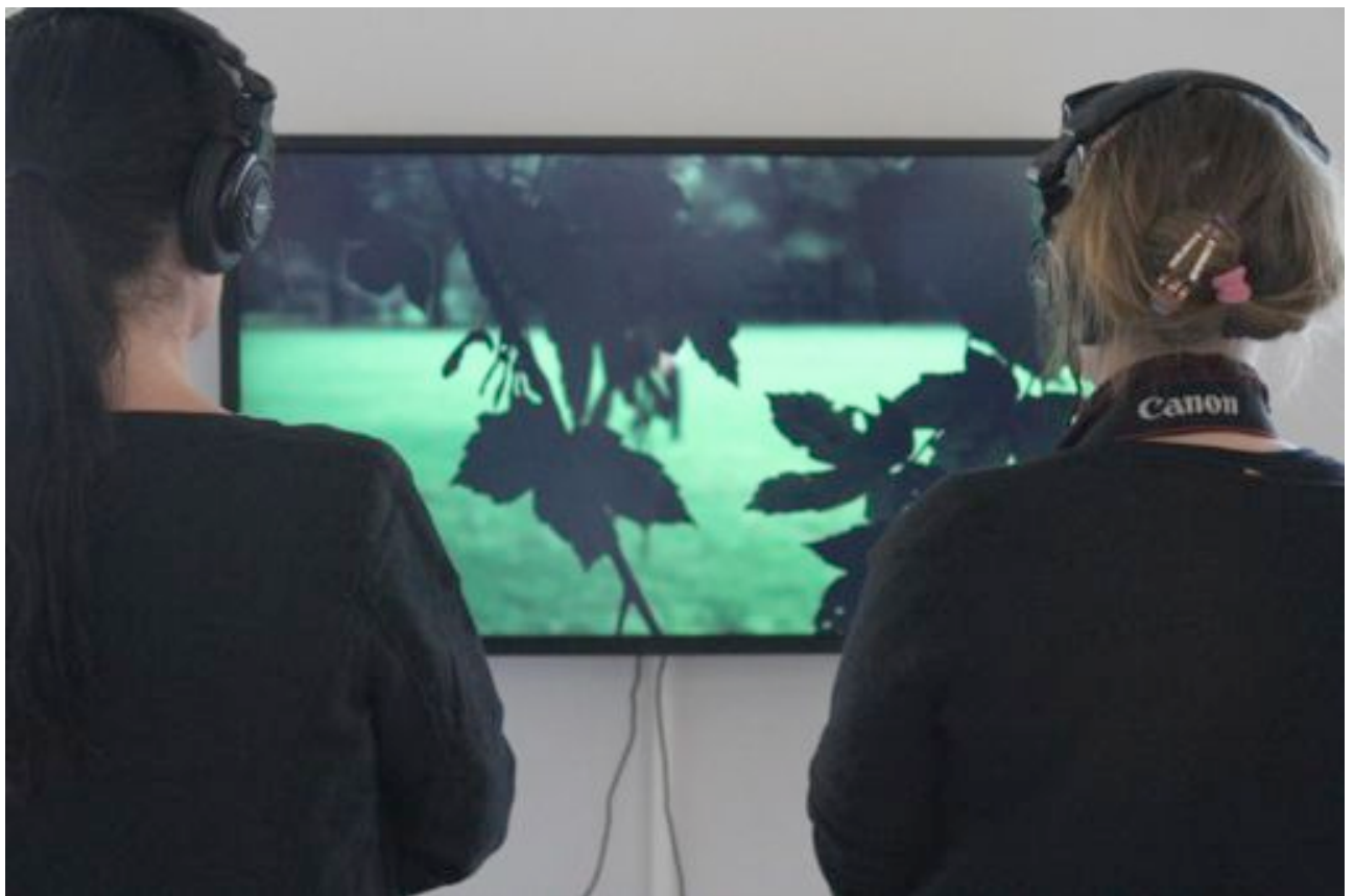
Margarida Paiva, Every story is imperfect , video, 2012 Østlandsutstillingen 2012 - Stereo. Not Mono