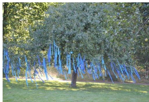
Tamer Serbay, Wishing Tree, 2012