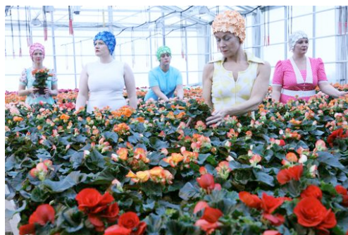
The Hungry Hearts: To adapt to form 1