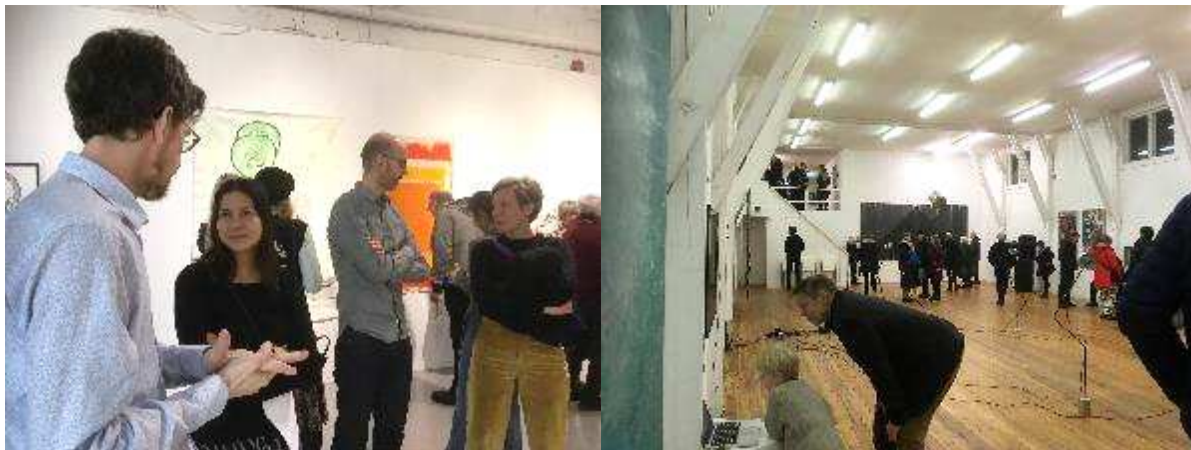
Bilder fra åpningene av Østlandsutstillingen (I) og (II) 2019, House of Foundation, Moss, og Røgden Bruk, Finnskogen.