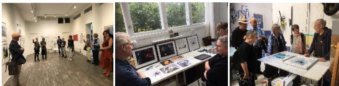
Foto fra preview og besøksprogram under Østlandsutstillingen 2019, Planning Future – Grafikk.