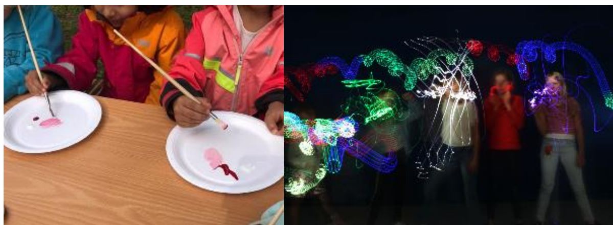
Formidling ved Kongsberg Kunstforening. Formidling ved Kunstforeningen Verdens Ende.

og aktiviteter, samt presentasjoner av alle deltagende kunstnere på facebook og på hjemmesiden førte til mye oppmerksomhet og de enkelte presentasjonene ble delt flere ganger.