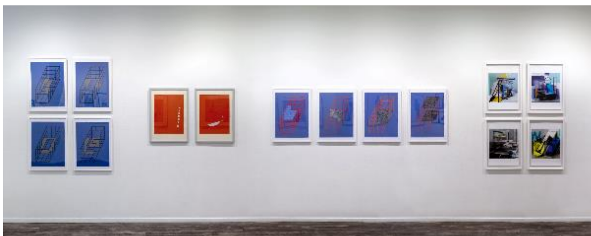
Dokumentasjonsfoto fra Østlandsutstillingen 2019, Planning Future – Grafikk .