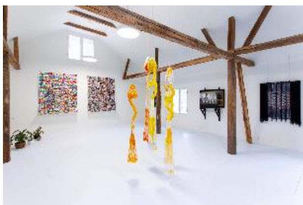
Installasjonsfoto fra Harpefoss Hotell.