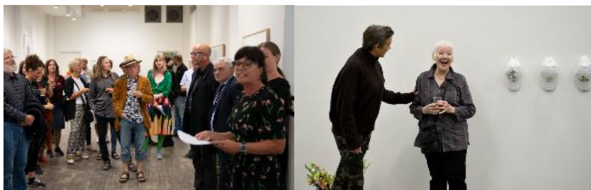
Foto fra åpningen i Norske Grafikere. Foto fra åpningen i Bærum Kunsthall.

Totalt ble det solgt 7 kunstverk i løpet av jubileumsåret 2019. Av disse var det 6 grafiske arbeider og en skulptur. Dette er flere salg enn tidligere år, og et gledelig resultat i jubileumsåret. Grunnene til dette kan være flere, men delvis tror vi dette er basert på at visningsstedene kjenner det lokale markedet og jobber med salg rettet mot dette.