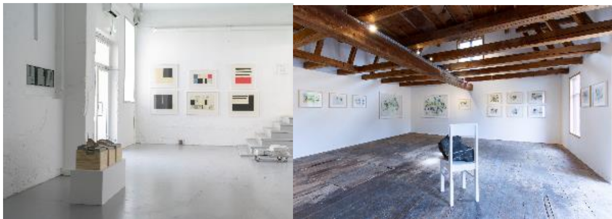
Installasjonsfoto fra House of Foundation. Installasjonsfoto fra Harpefoss hotel.

kunstnerskap og en balanse i kjønn, medier og generasjon samt presentasjon fra hvert tiår (1979-2019).