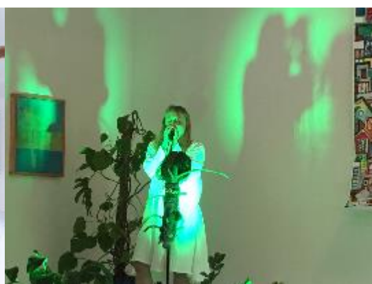
Monica Winther performance.